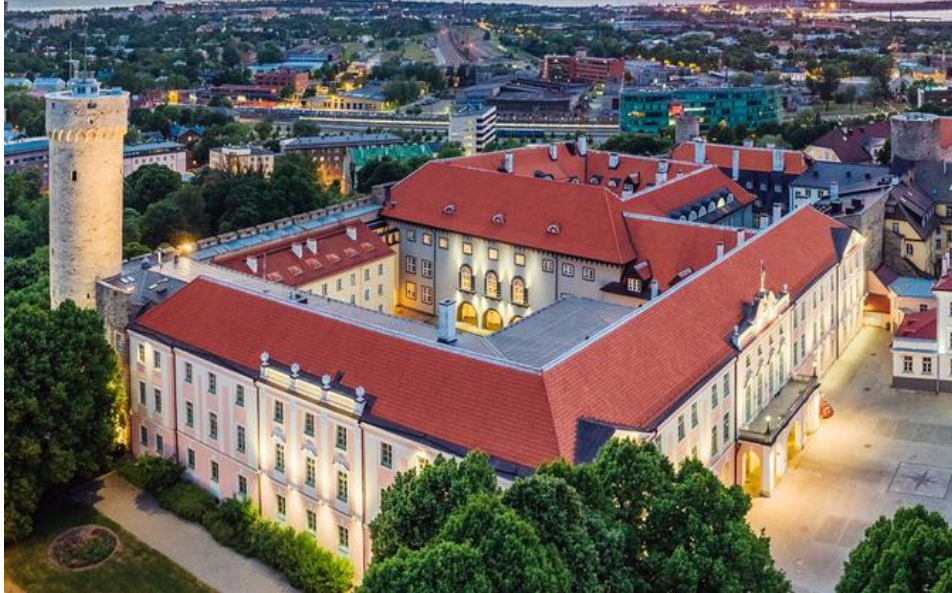
Estlands rigsdag - Riigikogu

Om formiddagen besøg i den estiske rigsdag , hvor vi først får en rundvisning. Herefter møde med en ledende politiker fra det liberale Reformparti , Venstres søsterparti. Besøget afsluttes med frokost i Rigsdagens restaurant. Herefter transfer til Tallinn lufthavn